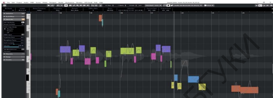
Рис. 2. График звуковысотности исполняемого произведения

нести всю информацию до ученика. Данный метод позволяет сразу понять всю картину целиком и детально проработать выбранные сегменты. При этом имеется возможность провести необходимый тюнинг непосредственно в секвенсоре и вывести обучаемому файл как эталонный образец относительно своего голоса.