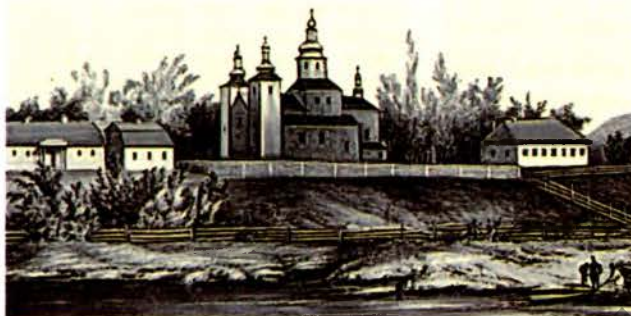
Пінскі Лежчанскі манастыр. З малюнка Н.Орды. 19 ст.

Знойдзены ў 1804 у г. Пінск Брэсцкай вобл. Уладальнік зямлі, на якой быў выяўлены імператару Аляксандру I 20 залатых манет, у тл. 6 златнікаў Уладзіміра Святаслава (980—1015), візант. намісмы Васілія II (976—1025) і Канстанціна VIII (1025—28), 4 або 5 намісмаў Рама-