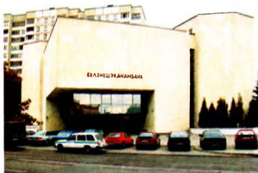
Здание Белвнешэкономбанка в Минске.

Здание банка построено в 1987 (архит. О.Воробьёв) в Минске по ул. Заславской на сложном участке рельефа с перепадом высоты до 10 м. Компактный квадратный в плане объём характеризуется выразительностью архитектуры фаса-