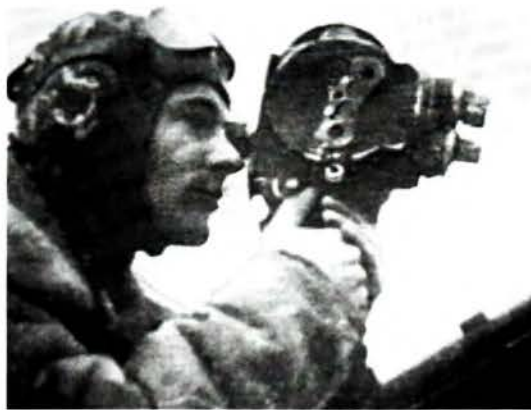
К ст. «Белвидео-центр». Кадр кинохроники из фильма «От зорь июньских».

БЕЛВНЕШЭКОНОМБАНК. универсальный банк; открытое акц. об-во. Образован 12.12.1991. Филиальная сеть насчитывает (2005) 26 филиалов, в т.ч. 5 региональных отделений в областных центрах, 6 отделений в Минске, 15 отделений в крупных городах. Открыты представительства в