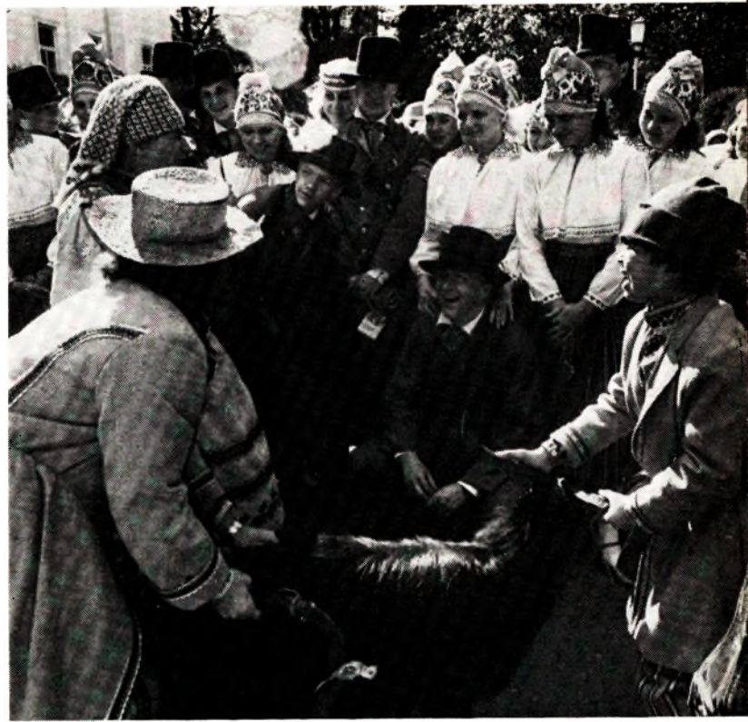
Сустрэча Гомельскага народнага фальклорнага тэатра музычнай камедыі «Жалейка» з фальклорнымі калектывамі з Прыбалтыкі.

У 60-ыя гады былі зменены вытворча-эканамічныя асновы народных мастацкіх промыслаў. З аднаго боку, пашырылася іх галіновая структура. З другога — на працягу 70-ых — 80-ых гадоў абвастрыліся супярэчнасці паміж творчымі працэсамі і прамысловай асновай арганізацыі вытворчасці мастацкіх вырабаў. Сёння, калі ў нашай краіне побач з дзяржаўнымі прадпрыемствамі зноў развіваюцца кааператыўныя формы мастацкіх промыслаў і індывідуальная працоўная дзейнасць, вопыт арганізацыі народных промыслаў у рэспубліцы набывае не толькі гістарычную, але і практычную цікавасць.