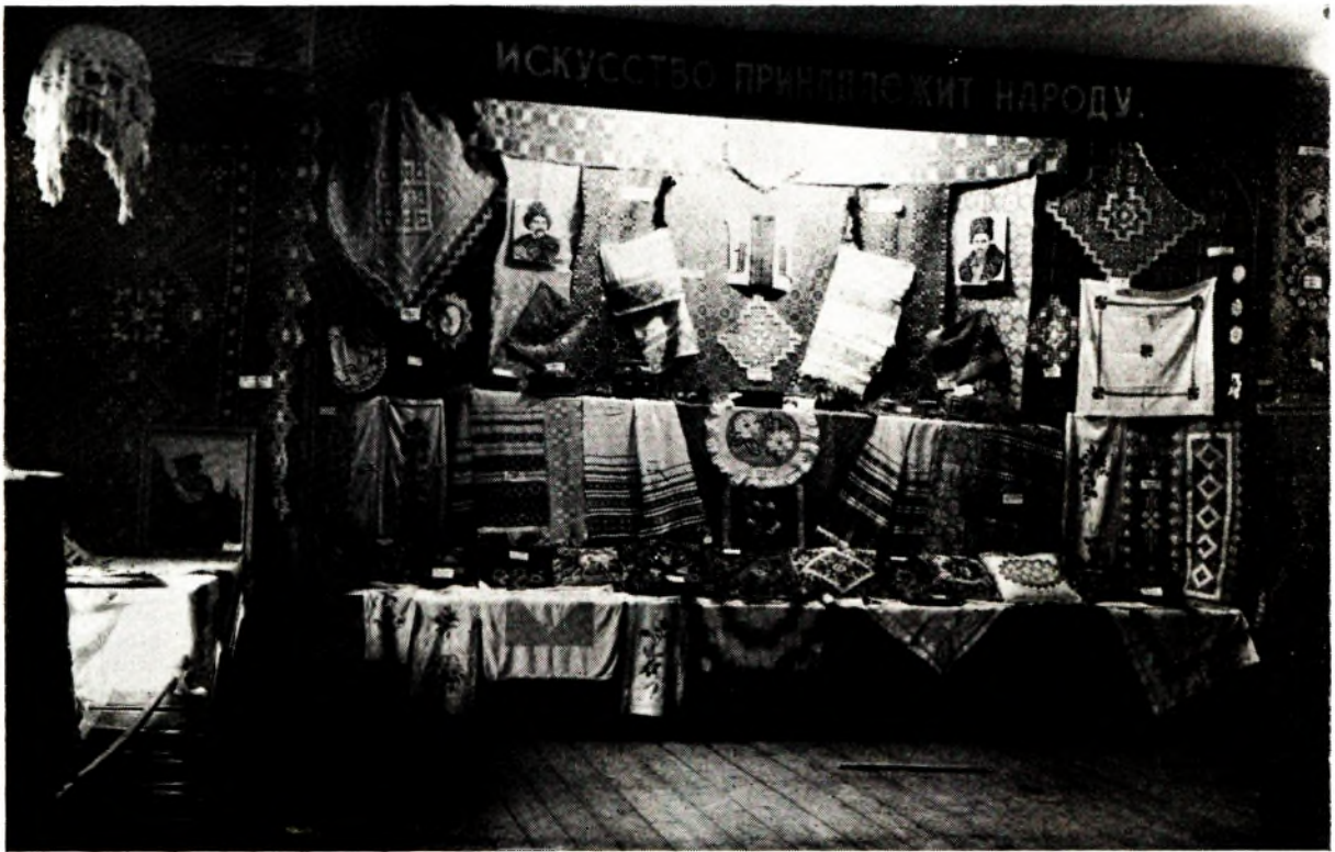
Агульны выгляд раздзела народнага мастацтва на дваццацімай Віцебскай абласной выстаўцы выяўленчага і прыкладнага мастацтва. 1955.

Н ародныя мастацкія промыслы Беларусі складаюць адну з самабытных частак культуры. Іх развіццё ў савецкі час, заснаванае на багатых традыцыях мінулага, вызначаецца многімі творчымі дасягненнямі, непасрэдным чынам звязанымі з уздымам культуры і эканомікі рэспублікі, пашырэннем навуковых ведаў пра беларускае народнае мастацтва.