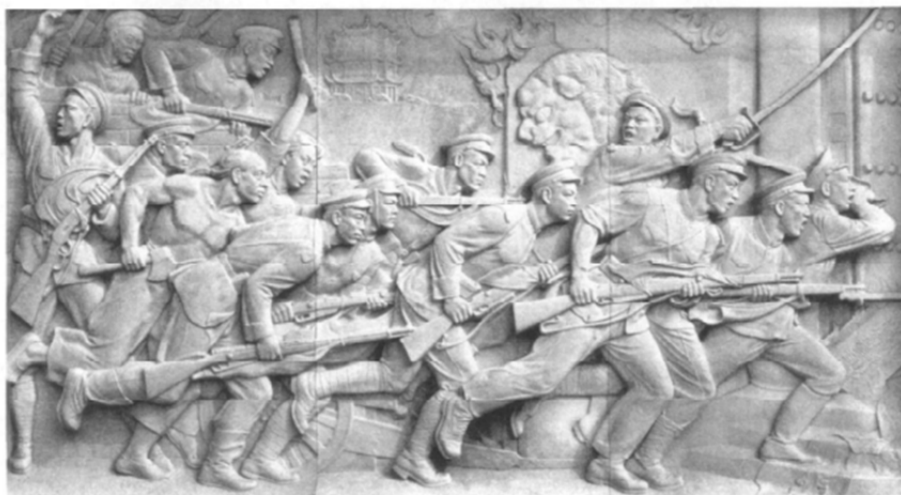
图1 傅天仇：《武昌起义》浮雕

большое количество коллективных идей. На барельефе изображен момент штурма резиденции наместника Хугуана революционными войсками в ходе Учанского восстания. Это классическое произведение послужило творческой базой для создания других работ на тему Учанского восстания последующими поколениями.