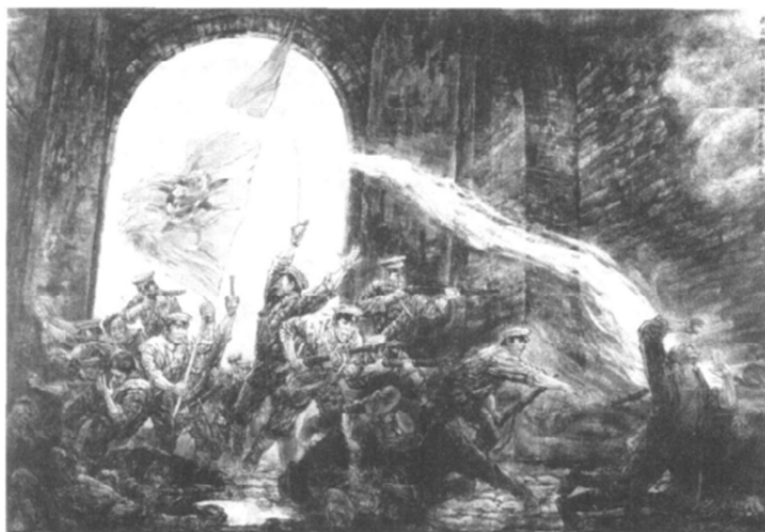
Рис. 3. Учанское восстание

классическим произведением традиционной китайской живописи на данную тему [1, с. 107].