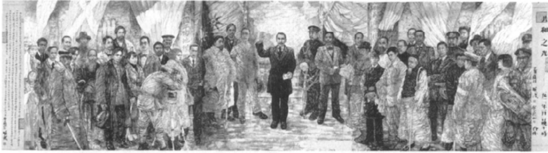
图2 贺成、贺兰山：《走向共和》