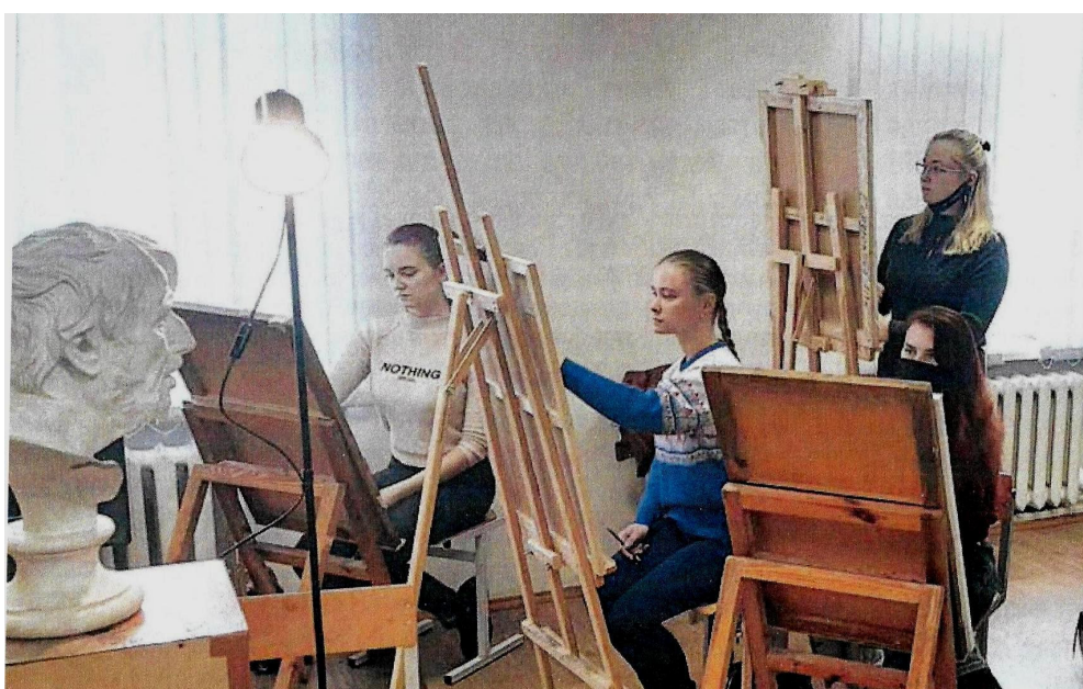
Заняття па акадэмічэскаму рысунку