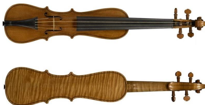
Рис. 4. Пошетта Антонио Страдивари, 1717 г.

В научно-исследовательской мастерской БГУКИ магистрантом специальности «Искусствоведение» Н. Родиной под руководством кандидата искусствоведения, мастера скрипичных инструментов А. Сурбы изготавливается пошетта по модели известного скрипичного мастера Антонио Страдивари, оригинал которой «Клаписсон» находится в музее парижской филармонии. На этикетке пошетты указано: «Antonius Stradivarius. Cremonensis Faciebat Anno 1717A+Sn». Данным инструментом владел французский скрипач и композитор Луи Клаписсон (рисунок 4).