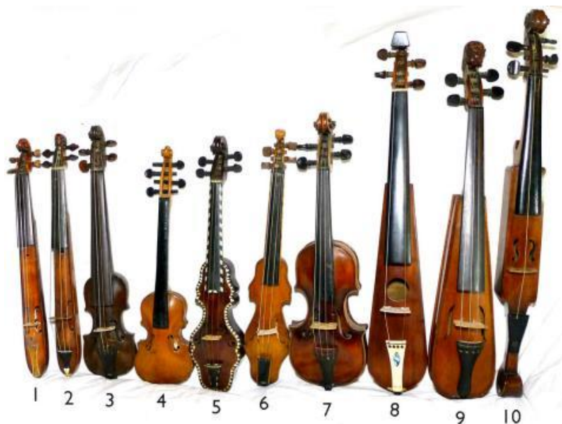
Рис. 2. Коллекция пошетт музея сестер Спрингер (Австрия) XVII-XVIII вв.

Четырехструнная скрипка лодочка с ребристой спинкой, как у лютни, инкрустированная перламутром в виде геометрических фигур на нижней деке и грифе, созданная в 1694 году немецким мастером И. Боллером хранится в музее во Франкфурте (Германия).