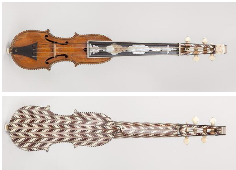
Рис. 3. Пошетта Джозефа Челониато, 1733 г.

шейке и головке скрипки, что придает экзотический вид инструменту (рисунок 3).