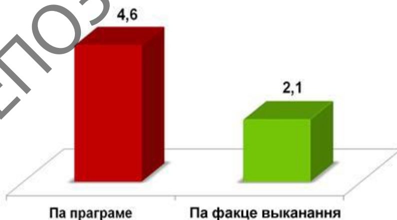
Мал. 3. Сярэдняя колькасць камп'ютараў на адну бібліятэку

Па стане на пачатак 2015 г. камп'ютарызавана 76 % агульнай колькасці публічных бібліятэк рэспублікі. У параўнанні з 2010 г., калі толькі 43 % бібліятэк мелі камп'ютарную тэхніку, гэты паказчык выглядае даволі значным. У той жа час, каб адпавядаць міжнародным стандартам у сферы інфарматызацыі, у бібліятэцы павінна быць не менш за адно аўтаматызаванае працоўнае месца на 1 тыс. жыхароў. Сёння машынны парк бібліятэк у 2,7 разы адстае ад паказчыкаў, прадугледжаных праграмай 1 (мал. 3):