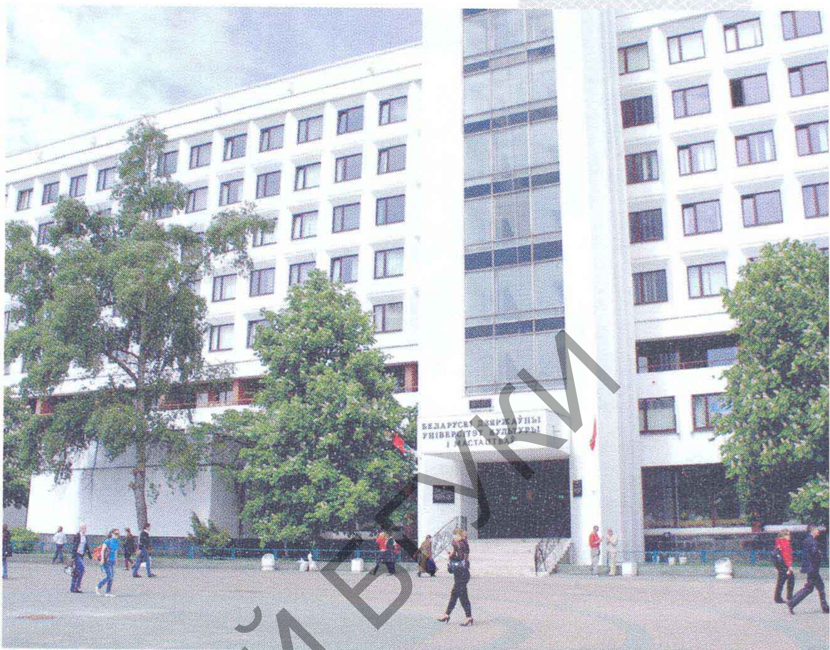
▲ Галоўны корпус БДУКіМ

Стратэгічная мэта і надзённая задача калектыву ўніверсітэта – фарміраванне фундаментальных кампетэнцый спецыяліста: навуковы светапогляд; гуманістычнае духоўна-маральнае развіццё; стымуляванне творчага, інавацыйнага мыслення; кампетэнтнасць у палітыцы і ідэалогіі дзяржавы; устойлівыя навыкі арганізатара ідэйна-