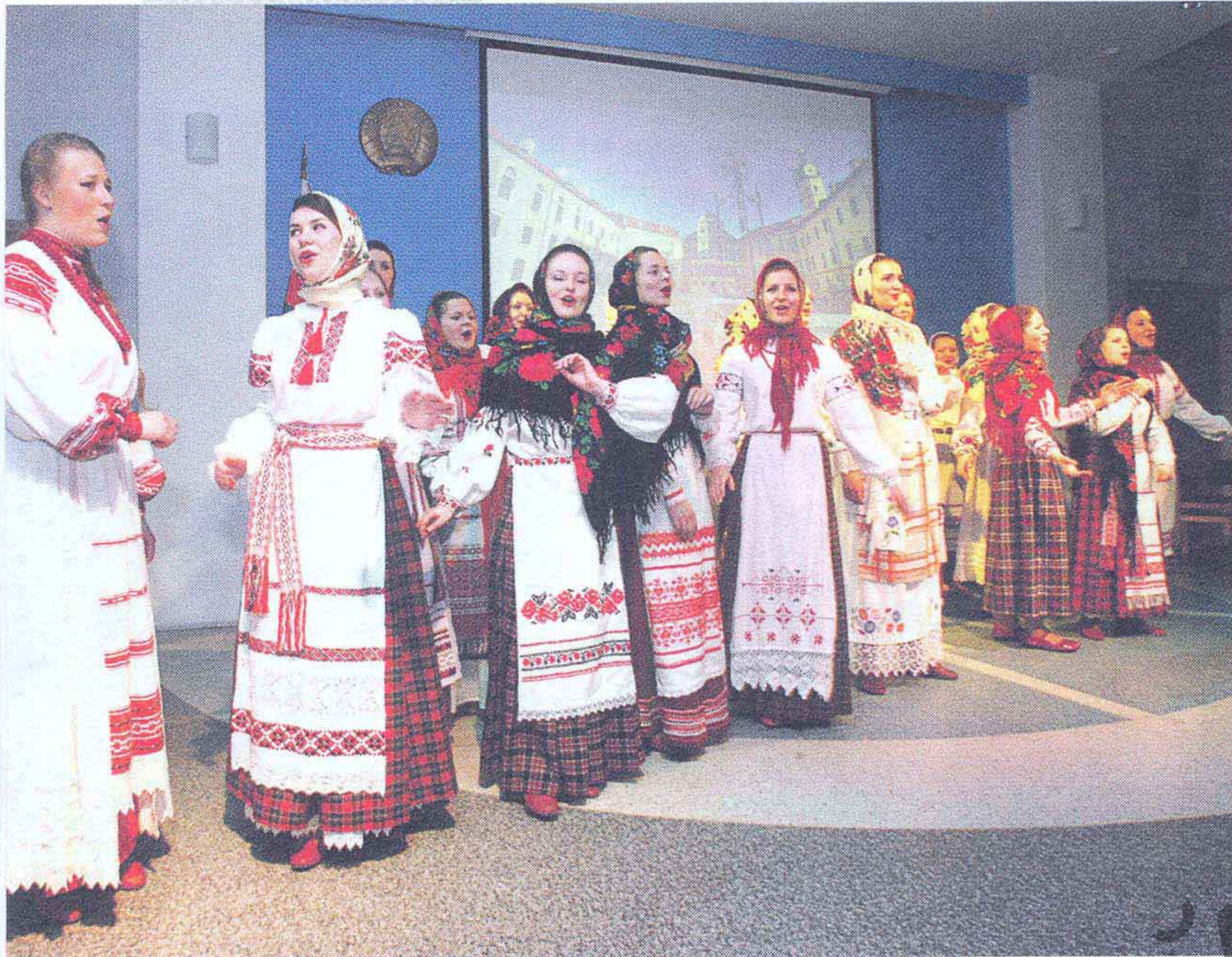
▲► Студэнткі БДУКіМ адзначаюць Дзень роднай мовы. 2012 год

культурных устаноў, распрацоўваць новыя арганізацыйна-кіраўнічыя структуры ў адпаведнасці з патрабаваннем часу і рэальнымі запытамі насельніцтва рэгіёнаў Беларусі.