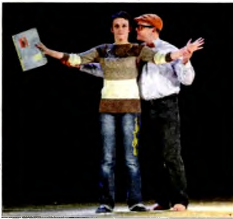
Сцэна са спектакля «Эдзіт Піяф. Мой Легіянер».