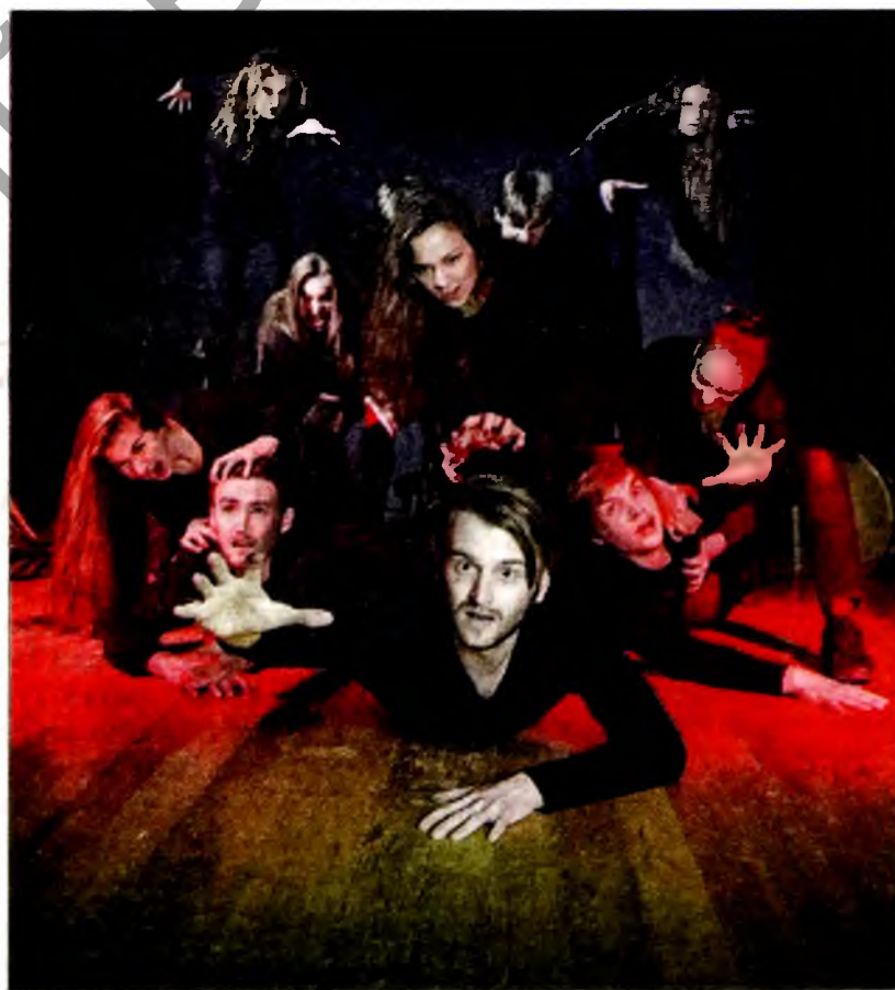
Сцэна са спектакля «Вій». Чытайце на стар. 8 ▶

У адным тыдні арганізатары паспрабавалі злучыць паказ спектакляў, майстар-класы, семінары і тэматычныя сустрэчы. Сёлета ўдзельнікамі «Тэатральнага куфра» сталі студэнцкія калектывы з Беларусі, Бельгіі, Вялікабрытаніі, Грузіі, Ірана, Эстоніі, Латвіі, Літвы, Польшчы, Расіі, Украіны і Эстоніі. Акрамя смелых эксперыментаў, увазе глядачоў былі прадстаўлены пастаноўкі на самую розную тэматыку: ад тэатральных адаптацый класікі беларускай літаратуры да матываў «Гамлета» Шэкспіра, «Вішнёвага сада» Чэхава. Старшынёй журы стаў доктар мастацтвазнаўства, тэатразнаўца, крытык Мака Васадзэ (Грузія, г. Тбілісі).