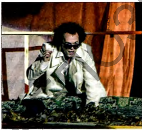
Сцэна са спектакля «Гамлет».

«Тэатральная студыя 29» Маскоўскага дзяржаўнага ўніверсітэта прадставіла ўвазе наведвальнікаў тэатральную пастаноўку «Гамлет». Творы легендарнага англійскага драматурга Уільяма Шэкспіра ніколі не страчваюць актуальнасці, яны вечныя, недарэмна многія з лепшых тэатраў свету славяцца яго пастаноўкамі. Па словах рэжысёра спектакля Андрэя Гарбатага, у кожным пакаленні ёсць свае Гамлеты, ён лічыць, што «Гамлет» карыстаецца вялікай цікавасцю і гэту тэатральную карціну кожны раз трэба ставіць па-новаму, бо вобразы застаюцца, а сітуацыі складваюцца не заўсёды аднолькава.