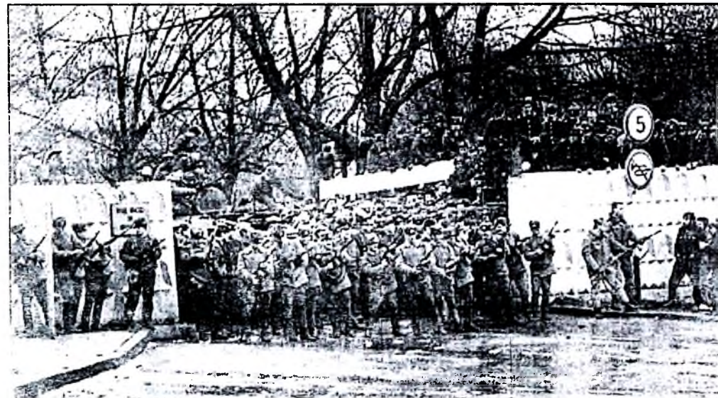
Кто отдал приказ ввести войска в Вильнюс, до сих пор неизвестно.

- Из Москвы дали команду ЦК компартии Беларуси требовать Вильнюс. Мол, раз вы хотите выйти из состава Советского Союза, отдайте наш город. Вы слышали о таком? Даже в газетах об этом стали писать. Так ЦК КПБ внезапно стал националистами. Кто-то перепугался, что и у нас начнут стрелять. В Верховном Союзе депутатов от БНФ было 12 процентов, они поддержали независимость Литвы.