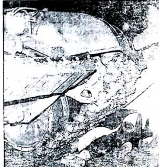
За независимость литовцам пришлось заплатить кровью.