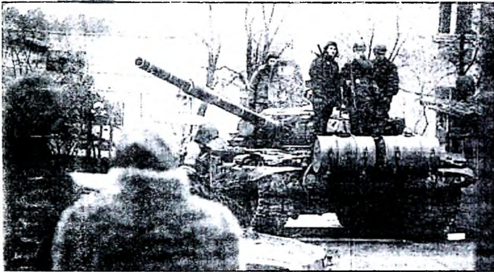
Вильнюс. Январь 1991 года.