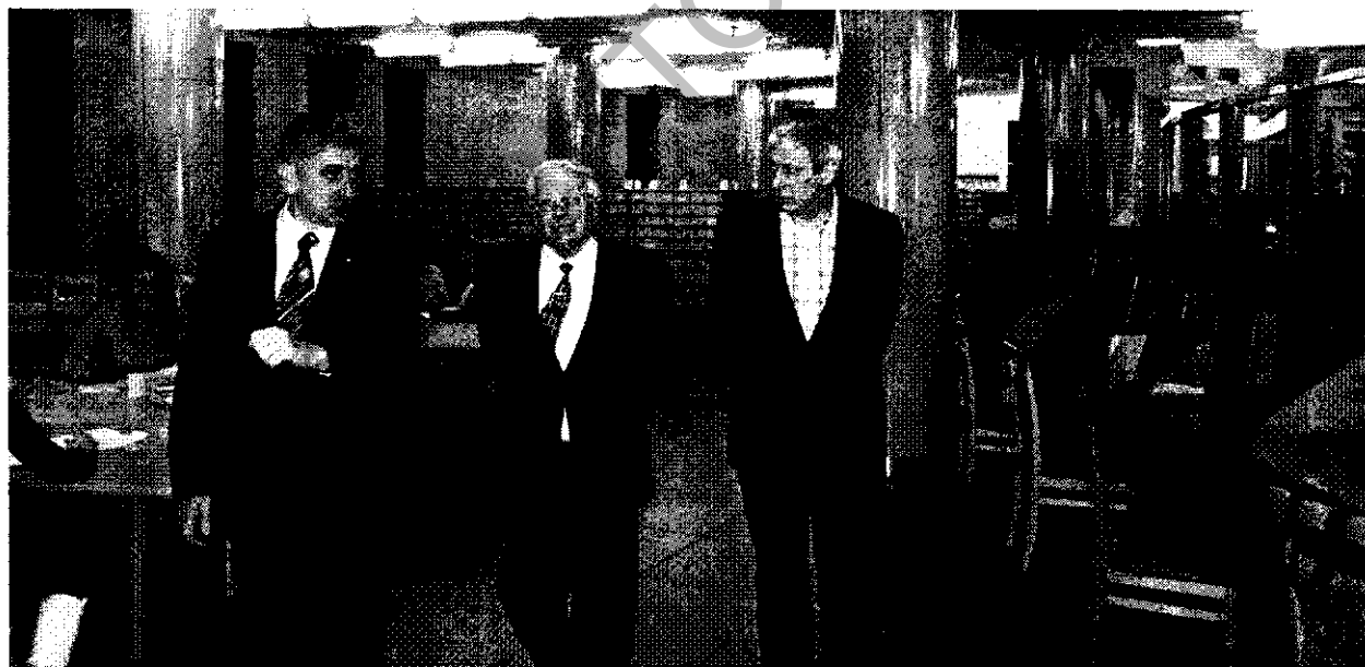
У Нацыянальнай бібліятэцы Беларусі

У красавіку ў нас у гасцях быў заведуючы аддзелам тэорыі і гісторыі кнігі Інстытута навучнай інфармацыі і бібліятэказнаўства Вроцлавскага ўніверсітэта (Польша), доктар Кшыштоф Мігань. Прафесар чытаў паточныя лекцыі для студэнтаў I курса па дысцыплінах «Дакументалогія» і «Гісторыя кнігі»; для магістрантаў, аспірантаў, прафесараў і работнікаў бібліятэк прачаў лекцыю на тэму «Навуковедчы статус навукі о кнізе (бібліялогіі) ў свеце. Тэрміналогія, паняццыйны апарат і методалогія сучаснага кнігаведства». Прайшоў круглы стół «Кніга як фактар культуры і прадмет даследа-