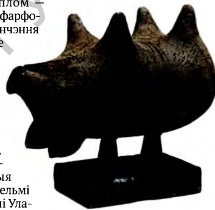
Прадчуванне. Дымленне, рэдукцыя. 2007.

Што да малой радзімы, то, безумоўна, усё адтуль: рэгіянальнае ў маіх працах перарастае ў нацыянальнае. Паданні, што з дзяцінства памятаю... На апошняй выставе паказаў «Судны дзень». Сабраліся продкі і пытаюць у нас, што мы зрабілі, што пакінулі сваім нашчадкам. Вось твор з апошніх: жанчыны ў намітках сапраўды падобныя да калон — іанічных, карыфскіх. Кампазіцыя, што цяпер у мяне на мольберце: «Збіральніцы святла». Таксама вобраз продкаў. Святло — гэта тое, што назапашана ў духоўным жыцці: ад Еўфрасіні Полацкай да Уладзіміра Караткевіча і Васіля Быкава. ■